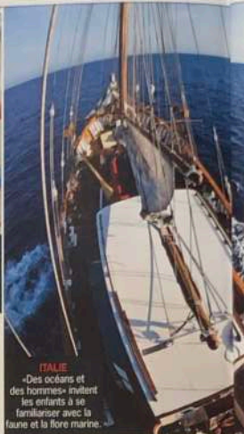
ITALIE «Des océans et des hommes» invitent les enfants à se familiariser avec la faune et la flore marine.

Dates: du 25 au 30 juillet, thème «Contes sur les chevaux, ânes et mulets» et du 8 au 14 août, thème «Les aborigènes d'Australie».