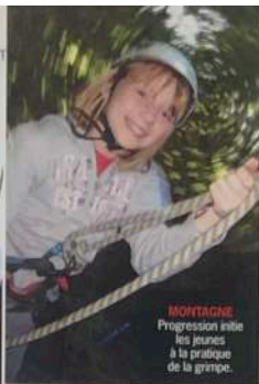
MONTAGNE Progression initie les jeunes à la pratique de la grimpe.